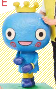
西宮市キャラクター「みやたん」